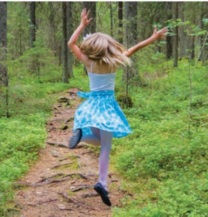
Kesälomariemua Lauhanvuoren kansallispuistossa.

Retken Isojoelle voi aloittaa Satakunnan rajan tuntumasta Mustasaarenkeitaalta. Lintutornille johtava esteetön, reilun kilometrin mittainen polku on juuri sopiva koko perheen reippailuun. Heinäkuussa olevilla Isojoen markkinoilla pääsee seuraamaan hauskaa köydenvetokilpailua metrilakun syömisen lomassa. Kangasjärven leirintäalueella saunoen ja kirikkaassa vedessä uiden virkistyy kesäisen päivän päätteeksi.