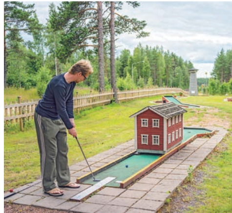
Lauhansarven luontomatkailukeskuksessa voi testata taitojaan minigolfin peluussa.