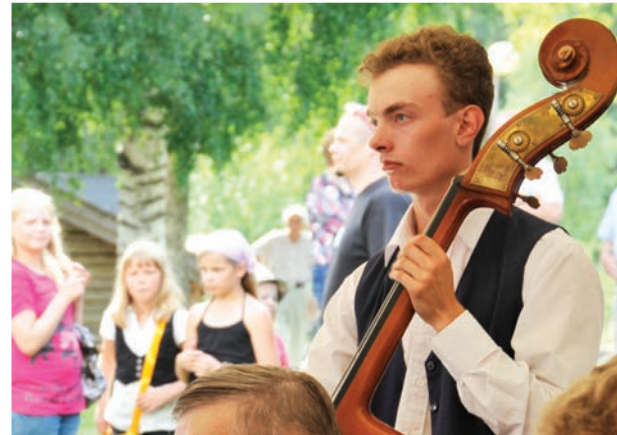
Lauhan Spelien musiikki ja upea tunnelma tempaavat mukaansa tänäkin kesänä